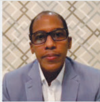
“Las plataformas Digitales en tiempos de Covid-19” -Ing. Morrison